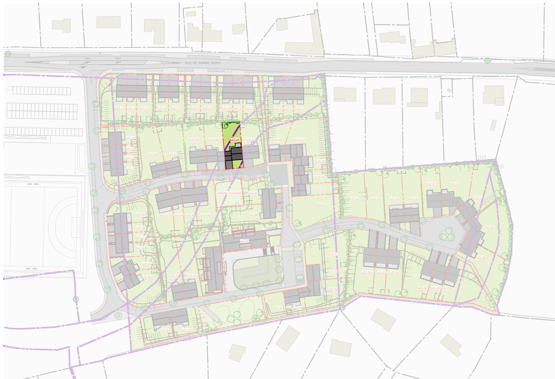
PLAN DE LOTISSEMENT